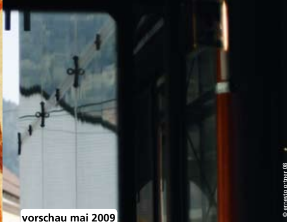
vorschau mai 2009