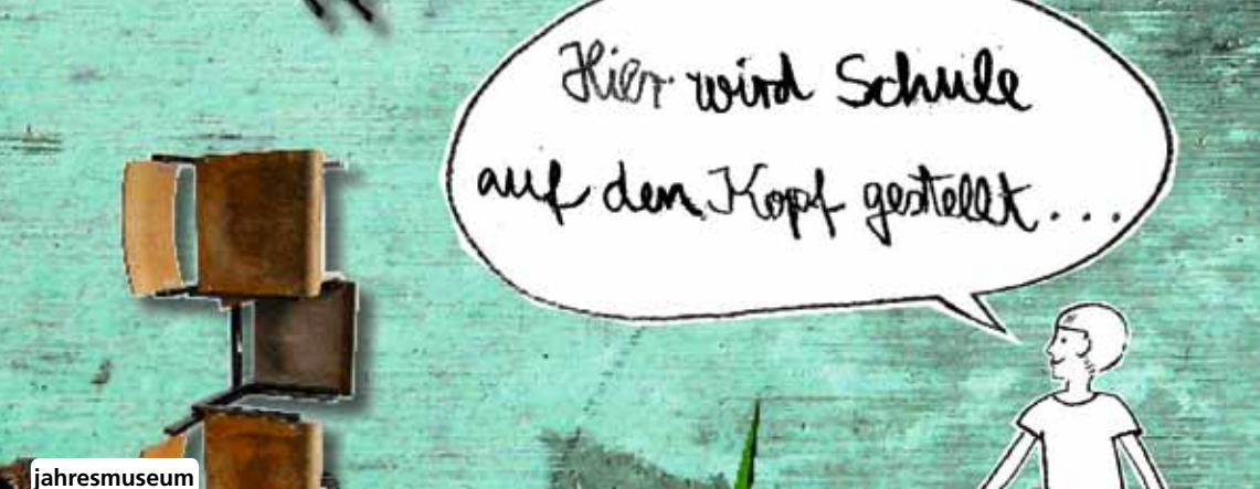
brücken in die gegenwart 2009